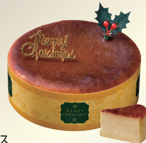
A47 ヤマザキ クリスマス 糖質を抑えたバスク風チーズケーキ 4号

※「日本食品標準成分表 2020年版のベイクドチーズケーキとの比較(100g当たり)で糖質37%オフ(エリスリトールを除いた糖質の比較では38%オフ)。