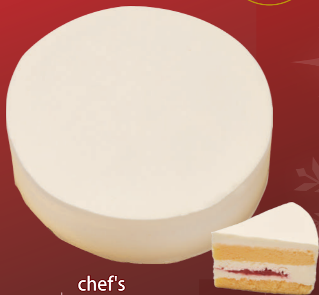
A01 chef's 飾らないケーキ 4号