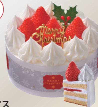
A46 ヤマザキ クリスマス 糖質を抑えた苺のケーキ 4号

※「日本食品標準成分表 2020年版のショートケーキ(果実なし)」との比較(100g当たり)で糖質58%オフ(エリスリトールを除いた糖質の比較では69%オフ)。