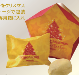
A51 ヤマザキ クリスマスレモンケーキ(5個入)

レモンのケーキをクリスマスデザインパッケージで包装し、クリスマス専用箱に入れた5個入製品。