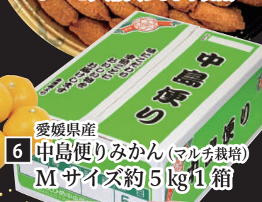
6 愛媛県産 中島便りみかん (マルチ栽培) Mサイズ約5kg 1箱