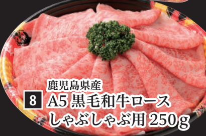
8 鹿児島県産 A5黒毛和牛ロース しゃぶしゃぶ用 250g