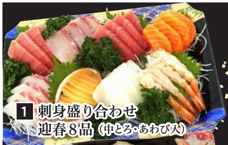
1 刺身盛り合わせ 迎春8品 (中とろ・あわび入)