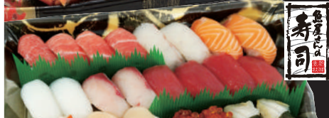
3 鮮魚寿司 迎春すし盛 (中とろ入) 24貫さび抜き