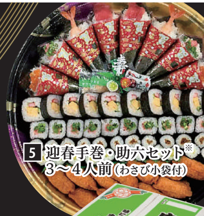
5 迎春手巻・助六セット 3~4人前 (わさび小袋付)