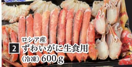
2 ロシア産 ずわいかに生食用 (冷凍) 600g